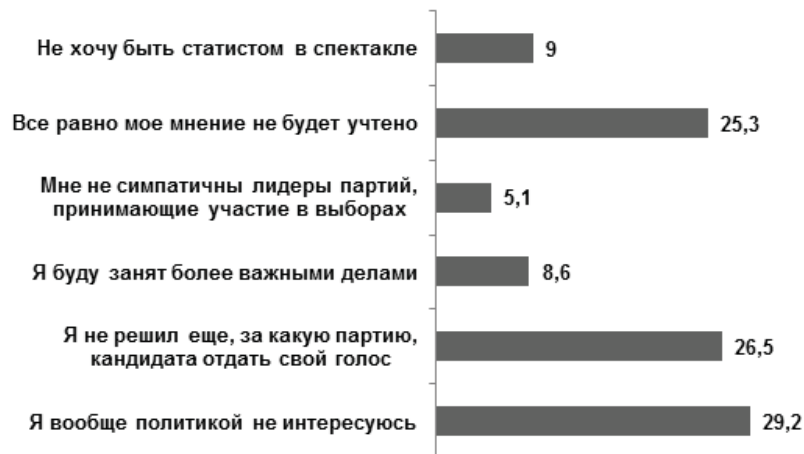
Рис. 2. Укажите причины, по которым Вы еще не приняли решения участвовать в выборах или отказаться от участия в них вообще (в % к числу опрошенных)

Распределение мотивов электорального поведения тех респондентов, которые приняли решение не участвовать в выборах или еще находились в процессе принятия решения, представлено на рисунке 2.