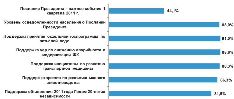
Рис. 3. Доля положительных оценок по ключевым индикаторам восприятия Послания Президента Казахстана народом РК от 28 января 2011 г.

Наконец, главным фактором формирования общественно-политической обстановки в 1 квартале 2011 г. стало дальнейшее укрепление экономики. По итогам года ВВП вырос на 7,5%. В январе были повышены пенсии и социальные выплаты. И здесь социологический мониторинг показывает укрепление Индекса социального самочувствия – со 147 до 149 баллов.