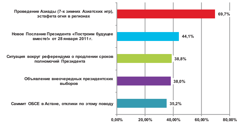
Рис. 1. Распределение ответов респондентов на вопрос: «Какие события, произошедшие в течение 2–3 месяцев, привлекли Ваше наибольшее внимание?»

о чем упомянули почти 93% респондентов, 89% из них назвали ее фактором единения казахстанского общества (табл. 1).