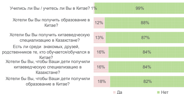
Рис. Казахстанцы о реалиях и перспективах получения образования в Китайской Народной Республике (%). N=544

В региональном разрезе ориентация на получение образования в Китае выше всего в Алматы. Здесь у 27% респондентов есть знакомые, друзья или родственники, которые обучаются или обучались в КНР. В южной столице 17% респондентов хотели бы сами получить образование и 32% — чтобы дети получили образование в Китае. 27% алматинцев выразили желание сами получить китаеведческую специализацию в Казахстане и 39% респондентов — чтобы дети специализировались в китаеведении на родине.