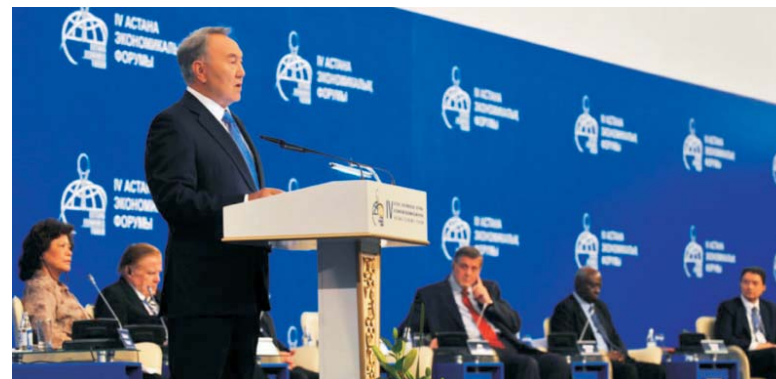
Президент Республики Казахстан Н.А. Назарбаев во время выступления на открытии IV Астанинского экономического форума