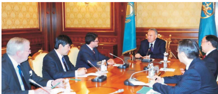
Встреча Президента Республики Казахстан Н.А. Назарбаева с Генеральным секретарем Парламентской Ассамблеи Организации по безопасности и сотрудничеству в Европе Р.С. Оливером

2.1.1. Встреча Президента Республики Казахстан Н.А. Назарбаева с Генеральным секретарем Парламентской Ассамблеи Организации по безопасности и сотрудничеству в Европе Р.С. Оливером