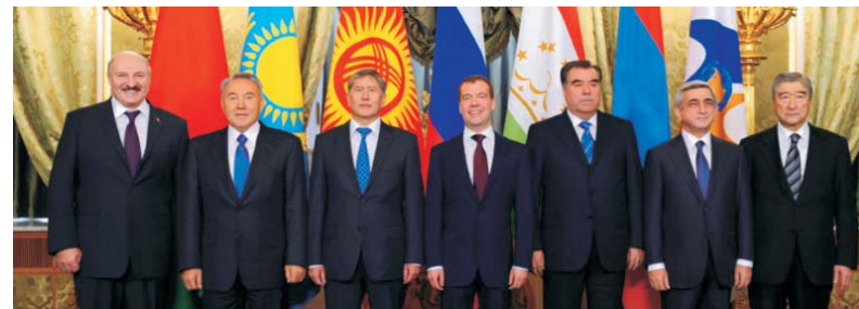
Участники 32-го заседания Межгосударственного совета ЕврАзЭС