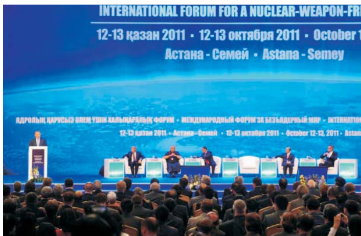
Президент Республики Казахстан Н.А. Назарбаев во время выступления на международном форуме «За безъядерный мир»

тию закрытия Семипалатинского испытательного полигона и Международному дню действий против ядерных испытаний