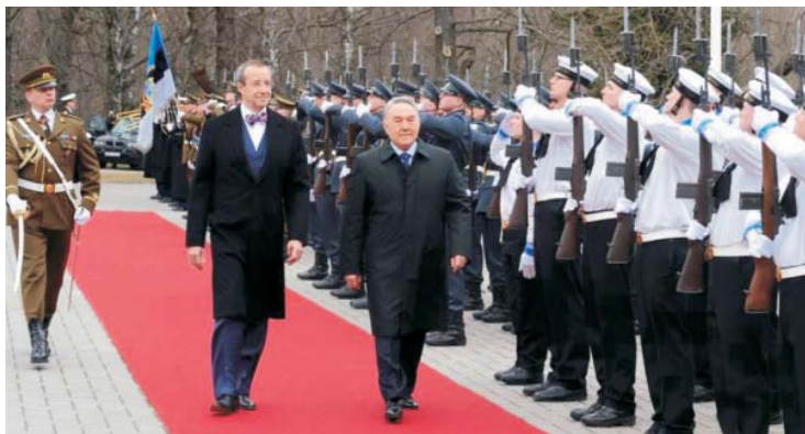
Президент Республики Казахстан Н.А. Назарбаев и Президент Эстонской Республики Тоомас Ильвес

ми деятелями, представителями деловых кругов Эстонии