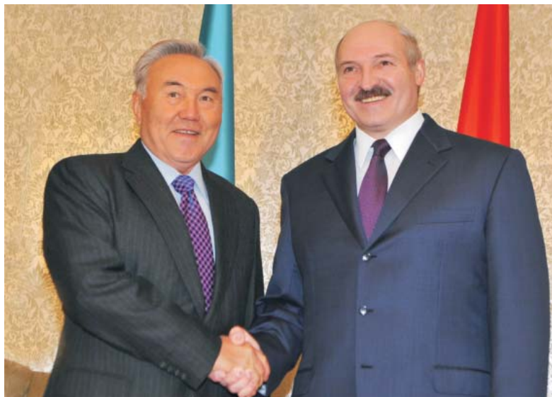
Президент Республики Казахстан Н.А. Назарбаев и Президент Республики Беларусь А.Г. Лукашенко