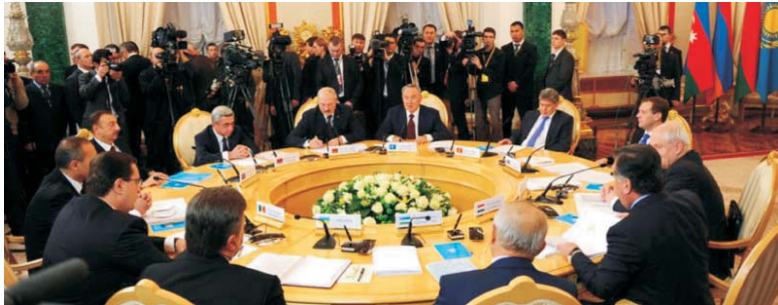
Президент Республики Казахстан Н.А. Назарбаев во время выступления на юбилейном заседании Совета глав государств — участников СНГ