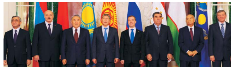
Участники сессии Совета коллективной безопасности ОДКБ