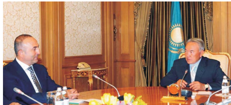
Президент Республики Казахстан Н.А. Назарбаев и Председатель Парламентской Ассамблеи Совета Европы Мевлют Чавушоглу