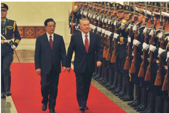
Президент Республики Казахстан Н.А. Назарбаев и Председатель Китайской Народной Республики Ху Цзиньтао