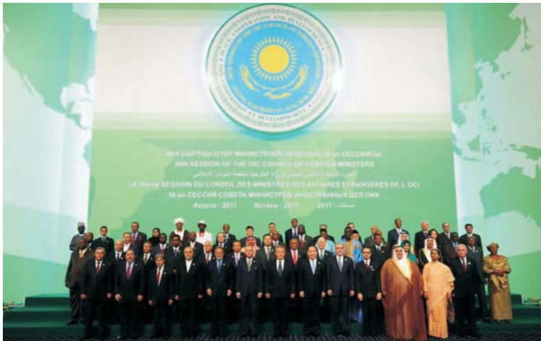
Участники 38-й сессии Совета министров иностранных дел Организации «Исламская конференция»