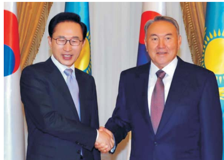
Президент Республики Казахстан Н.А. Назарбаев и Президент Республики Корея Ли Мён Бак