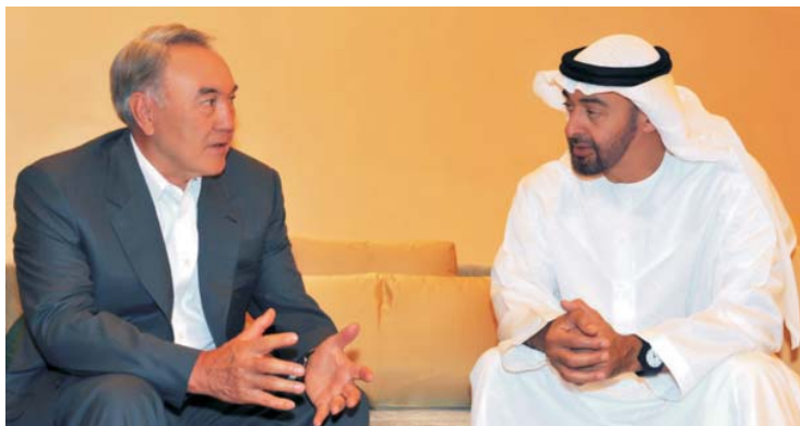
Президент Республики Казахстан Н.А. Назарбаев и Наследный принц эмирата Абу Даби шейх Мухаммед бен Заид Аль Нахаян

3 ноября 2011 года Глава государства Нурсултан Назарбаев в ходе рабочего визита в Объединенные Арабские Эмираты встретился с заместителем Верховного главнокомандующего Вооруженными силами ОАЭ, Наследным принцем эмирата Абу Даби шейхом Мухаммедом бен Заид Аль Нахаяном.