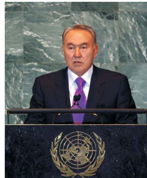
Президент Республики Казахстан Н.А. Назарбаев во время выступления на заседании высокого уровня по ядерной безопасности

22 сентября 2011 года Президент Казахстана Нурсултан Назарбаев принял участие в заседании высокого уровня по ядерной безопасности, которое состоялось в штаб-квартире Организации Объединенных Наций в г. Нью-Йорке. В мероприятии приняли участие главы государств — членов ООН: Казахстана, Франции, Республики Корея, Японии, Бразилии,