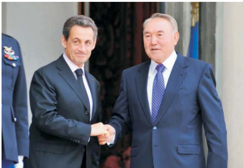
Президент Республики Казахстан Н.А. Назарбаев и Президент Французской Республики Николя Саркози