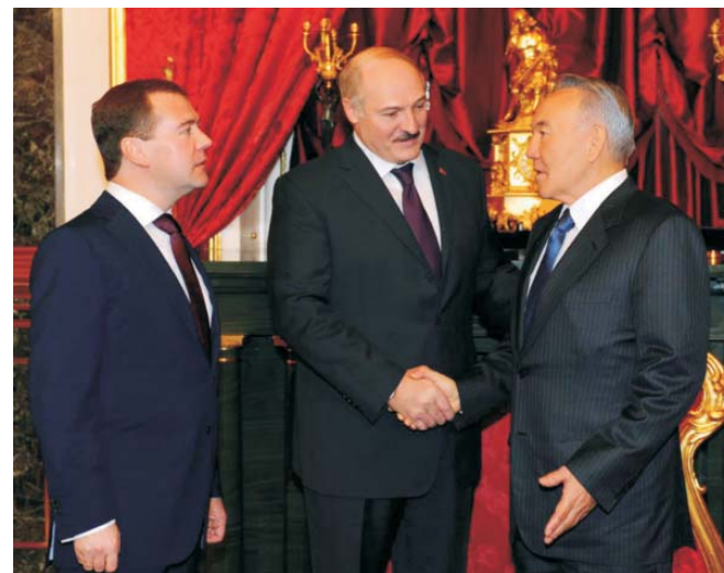
Президент Республики Казахстан Н.А. Назарбаев, Президент Республики Беларусь А.Г. Лукашенко, Президент Российской Федерации Д.А. Медведев