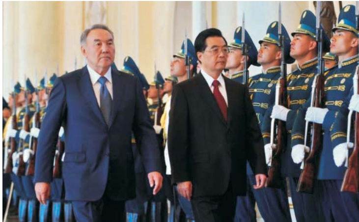
Президент Республики Казахстан Н.А. Назарбаев и Председатель Китайской Народной Республики Ху Цзиньтао