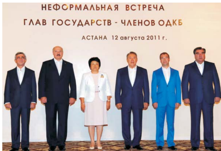
Президент Республики Казахстан Н.А. Назарбаев, Президент Республики Армения С.А. Саргсян, Президент Республики Беларусь А.Г. Лукашенко, Президент Кыргызской Республики Р.И. Отунбаева, Президент Российской Федерации Д.А. Медведев, Президент Республики Таджикистан Э.Ш. Рахмон

12 августа 2011 года в Астане состоялась неформальная встреча глав государств — членов Организации Договора о коллективной безопасности.