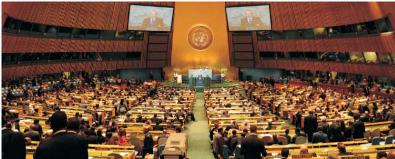
Президент Республики Казахстан Н.А. Назарбаев во время выступления на 66-й сессии ГА ООН