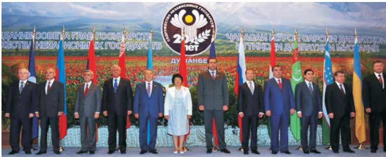
Главы государств — участников Содружества Независимых Государств