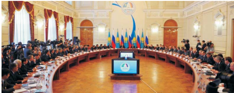
Пленарное заседание VIII Форума межрегионального сотрудничества Республики Казахстан и Российской Федерации