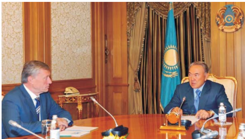
Президент Республики Казахстан Н.А. Назарбаев и Генеральный секретарь ОДКБ Н.Н. Бордюжа

11 августа 2011 года Президент Казахстана Н.А. Назарбаев принял в Акорде Генерального секретаря ОДКБ Н.Н. Бордюжу.