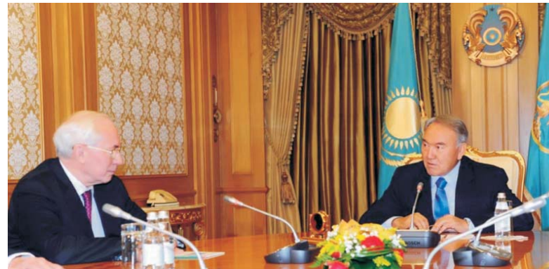
Президент Республики Казахстан Н.А. Назарбаев и Премьер-министр Украины Н.Я. Азаров

В ходе встречи в Акорде Президент Казахстана и Премьер-министр Украины обсудили широкий спектр вопросов двусторонних взаимоотношений, в частности, вопросы сотрудничества в инвестиционной и торгово-финансовой сферах.