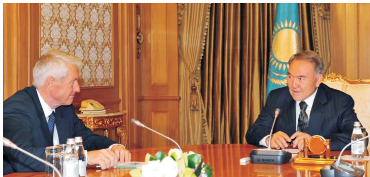
Президент Республики Казахстан Н.А. Назарбаев и Генеральный секретарь Совета Европы Торбьорн Ягланд