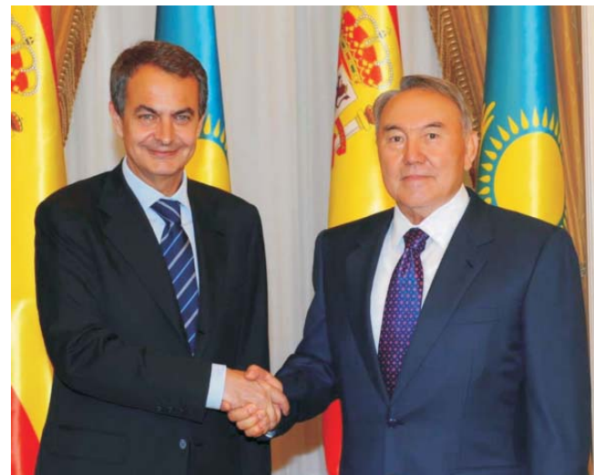
Президент Республики Казахстан Н.А. Назарбаев и Председатель Правительства Королевства Испания Хосе Луис Сапатеро