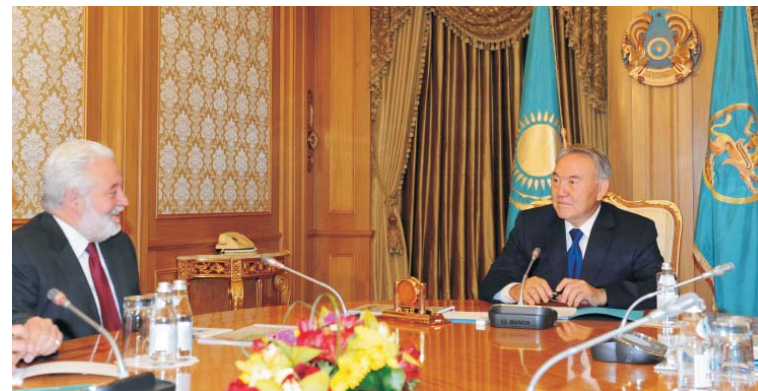
Президент Республики Казахстан Н.А. Назарбаев и Генеральный секретарь Международного бюро выставок Висенте Гонсалес-Лоссерталес

В ходе встречи в Акорде Президент РК и Генеральный секретарь МБВ обсудили перспективы взаимодействия между казахстанской стороной и Международным бюро выставок, а также возможности проведения международной выставки «Экспо-2017» в Астане.