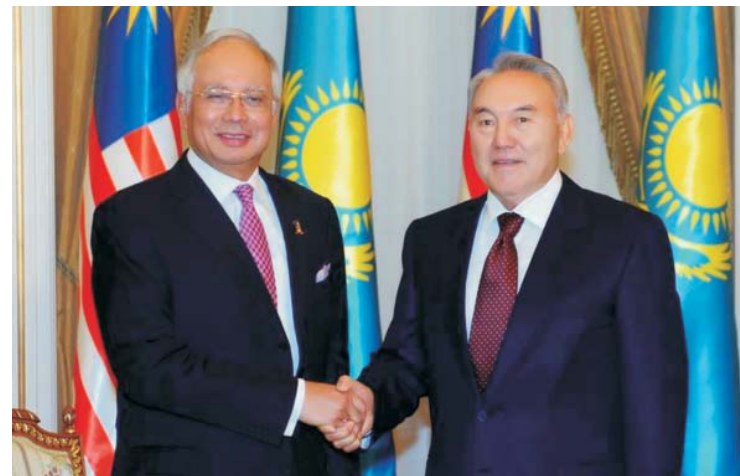
Президент Республики Казахстан Н.А. Назарбаев и Премьер-министр Малайзии Дато Шри Мохд Наджиб Тун Абдул Разак