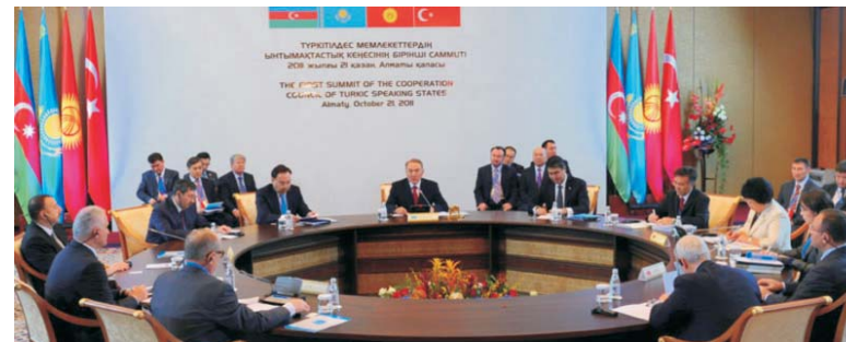
Президент Республики Казахстан Н.А. Назарбаев во время выступления на 1-м Саммите Совета сотрудничества тюркоязычных государств