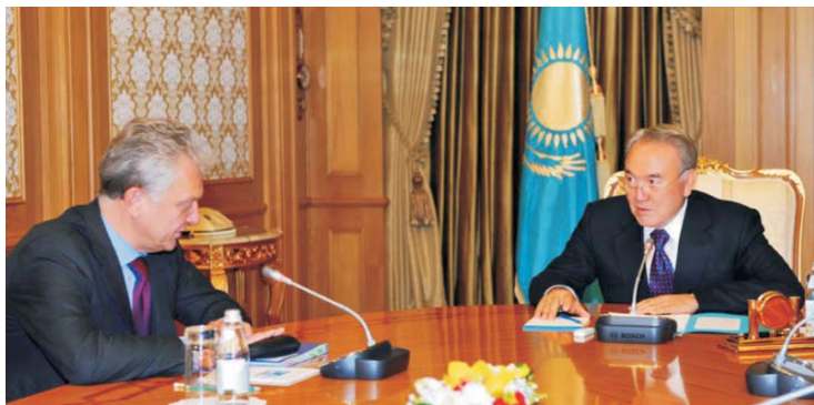
Президент Республики Казахстан Н.А. Назарбаев и Специальный представитель Президента Российской Федерации в Таможенном союзе В.Б. Христенко

В ходе встречи в Акорде были обсуждены вопросы двустороннего сотрудничества, а также вопросы деятельности Таможенного союза.