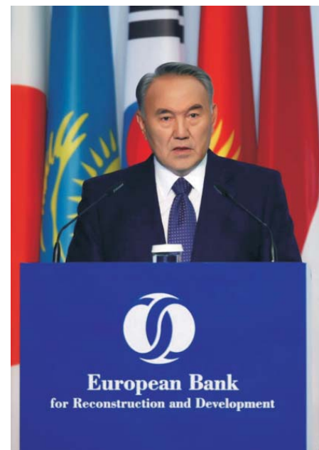
Президент Республики Казахстан Н.А. Назарбаев во время выступления на Первой пленарной сессии Ежегодного заседания Совета управляющих Европейского банка реконструкции и развития

20 мая 2011 года в Астане Глава государства Нурсултан Назарбаев принял участие в Первой пленарной сессии Ежегодного заседания Совета управляющих Европейского банка реконструкции и развития.