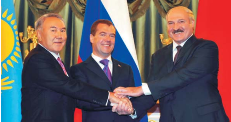
Президент Республики Казахстан Н.А. Назарбаев, Президент Российской Федерации Д.А. Медведев, Президент Республики Беларусь А.Г. Лукашенко