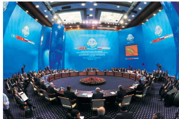
Заседание Совета глав государств — членов ШОС