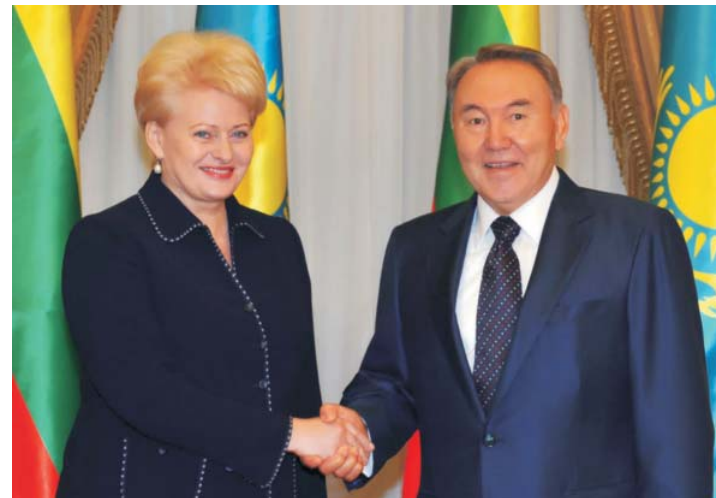
Президент Республики Казахстан Н.А. Назарбаев и Президент Литовской Республики Дали Грибаускайте