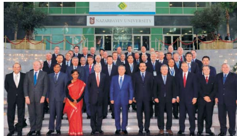
Участники 24-го пленарного заседания Совета иностраннх инвесторов при Президенте Республики Казахстан

18 мая 2011 года в Астане под председательством Главы государства Нурсултана Назарбаева состоялось 24-е пленарное заседание Совета иностраннх инвесторов при Президенте Республики Казахстан, посвященное теме «Модернизация и обновление предприятий Казахстана».