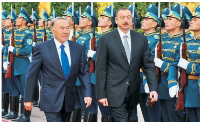
Президент Республики Казахстан Н.А. Назарбаев и Президент Азербайджанской Республики И.Г. Алиев