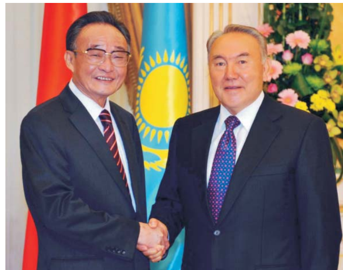
Президент Республики Казахстан Н.А. Назарбаев и Председатель Постоянного комитета Всекитайского собрания народных представителей Китайской Народной Республики У Банго

27 сентября 2011 года в Акорде состоялась встреча Президента РК Н.А. Назарбаева с Председателем Постоянного комитета Всекитайского собрания народных представителей КНР У Банго.