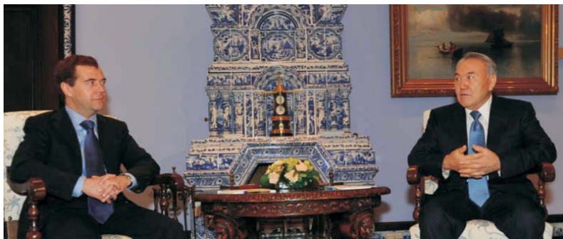
Президент Республики Казахстан Н.А. Назарбаев и Президент Российской Федерации Д.А. Медведев