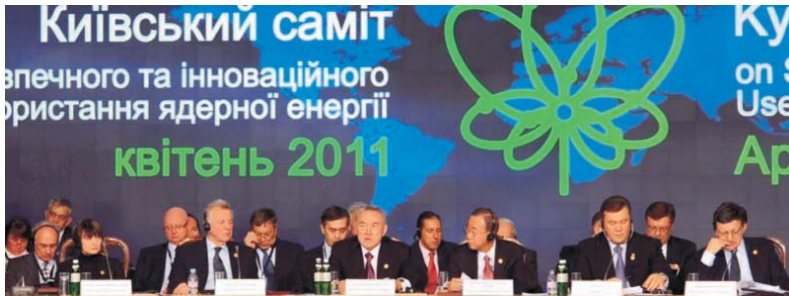
Президент Республики Казахстан Н.А. Назарбаев во время выступления на пленарном заседании саммита