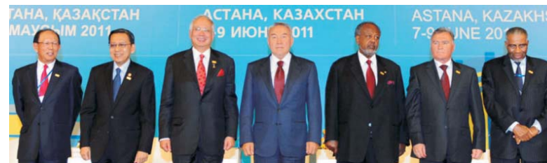
Участники VII Всемирного исламского экономического форума