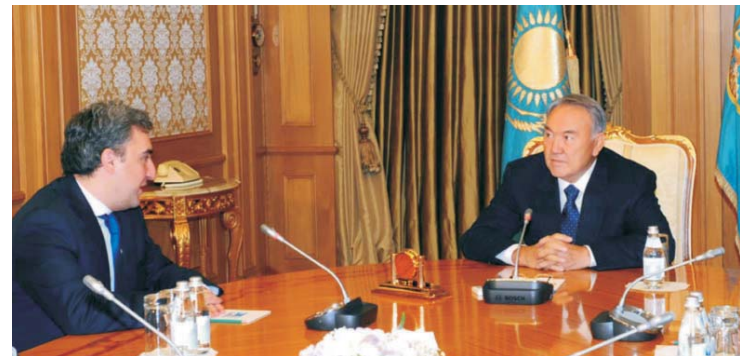
Президент Республики Казахстан Н.А. Назарбаев и Премьер-министр Грузии Николоз Гилаури

В ходе встречи в Акорде Президент Казахстана и Премьер-министр Грузии обсудили актуальные вопросы развития двусторонних отношений. Были рассмотрены перспективы торгово-экономического сотрудничества двух стран.