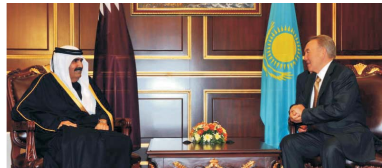
Президент Республики Казахстан Н.А. Назарбаев и Эмир Государства Катар Хамад бин Халифа ат-Тани