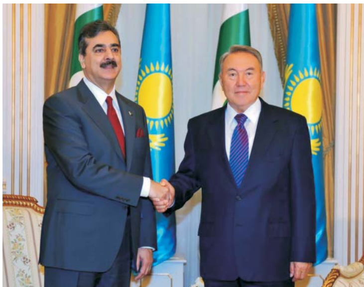
Президент Республики Казахстан Н.А. Назарбаев и Премьер-министр Исламской Республики Пакистан Сайед Юсуф Реза Гилани