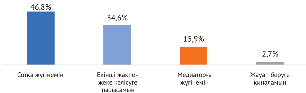
2-сурет. Азаматтық дау немесе қылмыстық құқық бұзушылықтармен кездескен жағдайда Сіз жанжалды шешудің қандай түрін таңдайсыз?

Сауалнама кезінде респонденттердің басым бөлігі қажет болған жағдайда, дауды шешу үшін сотқа жүгінуді қалайтындар – 46,8%.