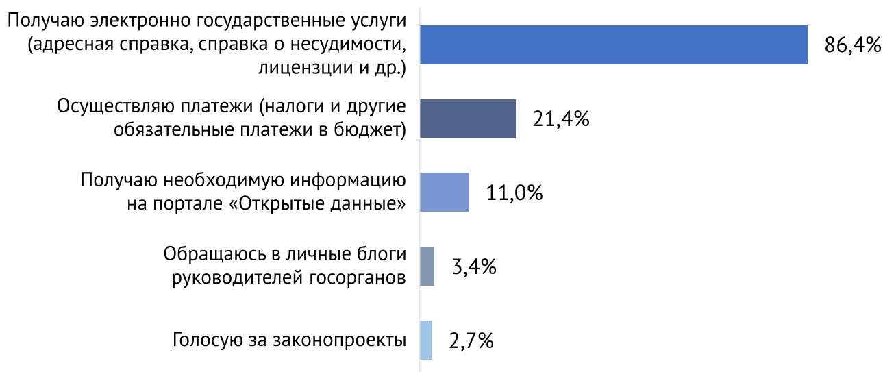
Рис. 2. Какими услугами и сервисами электронного правительства egov.kz Вы пользуетесь?

Каждый пятый респондент осуществляет через портал Электронного правительства различные платежи – налоги и т.д. Открытыми данными пользуется только каждый десятый респондент, голосуют за законопроекты только 2,7% опрошенных. В личные блоги руководителей госорганов обращаются 3,4% респондентов.