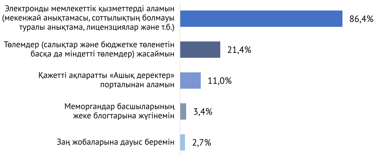
2-сурет. Сіз egov.kz электронды үкіметтің қандай қызметтері мен сервистерін қолданасыз?

Әрбір бесінші респондент Электронды үкімет порталы арқылы түрлі төлемдерді – салықтарды және т.с.с. төлейді. Тек қана әрбір оныншы респондент ашық деректерді қолданады, сауалнама алынғандардың 2,7%-ы ғана заң жобаларына дауыс береді. Меморгандар басшыларының жеке блогтарына респонденттердің 3,4%-ы жүгінеді.