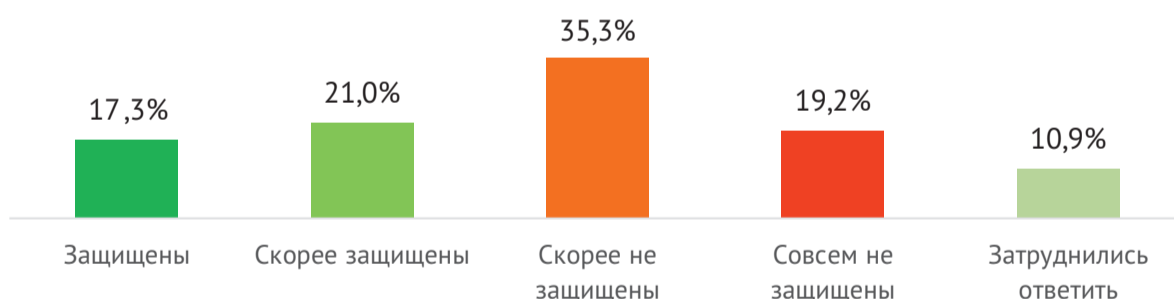
Рис 2. Насколько сегодня Вы лично чувствуете себя защищённым от экологической угрозы?

37,3% респондентов ответили, что чувствуют себя защищенными от экологической угрозы . Доля тех, кто чувствует экологическую угрозу, выше и составляет 54,5% от всех опрошенных. Те же 19,2% респондентов, которые полностью не удовлетворены экологией, также заявили, что совсем не защищены от экологических угроз.