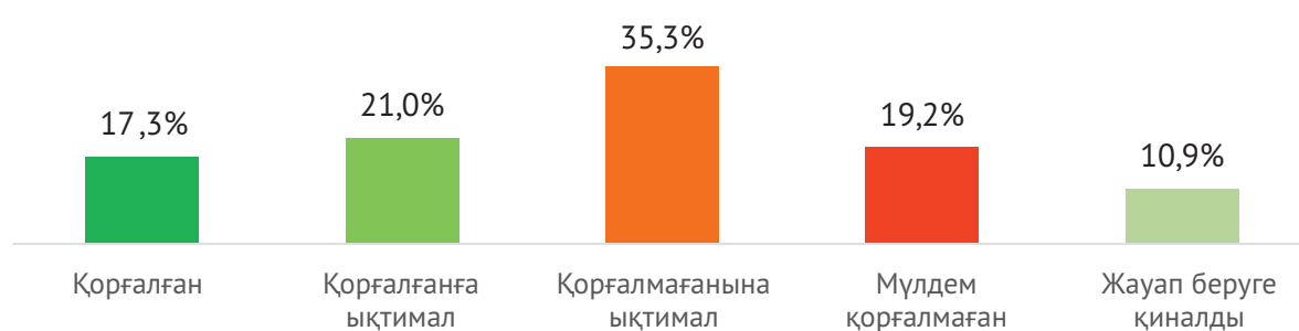
2 сурет. Сіз өзіңіз қоршаған ортаңыздың қауіп-қатерінен қорғалғаныңызды қалай сезінесіз?

Респонденттердің 37,3%-ы экологиялық қауіптен қорғалғанын сезінетіндіктеріне жауап берді. Экологиялық қауіпті сезінетіндердің үлесі жоғары және барлық сұралғандардың 54,5%-н құрайды. Қоршаған ортаға мүлдем қанағаттанбаған респонденттердің 19,2%-ы экологиялық қауіптен мүлдем қорғалмағанын мәлімдеді.