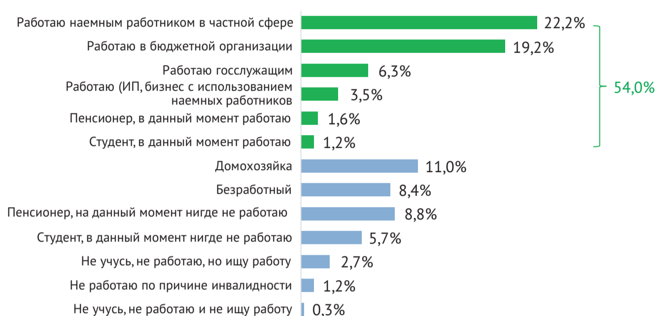
Рис. 1. Чем Вы занимаетесь в настоящее время?

Доля работающих пенсионеров (1,6%) и студентов (1,2%) в нашем обществе невелика.