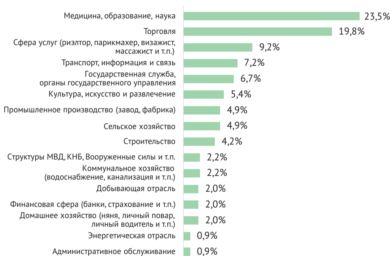
Рис. 2. В какой сфере (отрасли) Вы работаете?

Чаще всего казахстанцы трудятся в сфере медицины, образования и культуры. Эти сферы выбрали в своих ответах 23,5% респондентов. Каждый пятый работающий казахстанец трудится в торговле. В каждой из остальных сфер задействовано не более 10% казахстанцев. Более всего из них представлена сфера услуг – 9,2% респондентов работают в ней. А, например, в домашнем хозяйстве в качестве няней, личных поваров и т.д. трудятся 2% респондентов, как правило, более молодого и, наоборот, пенсионного возраста.