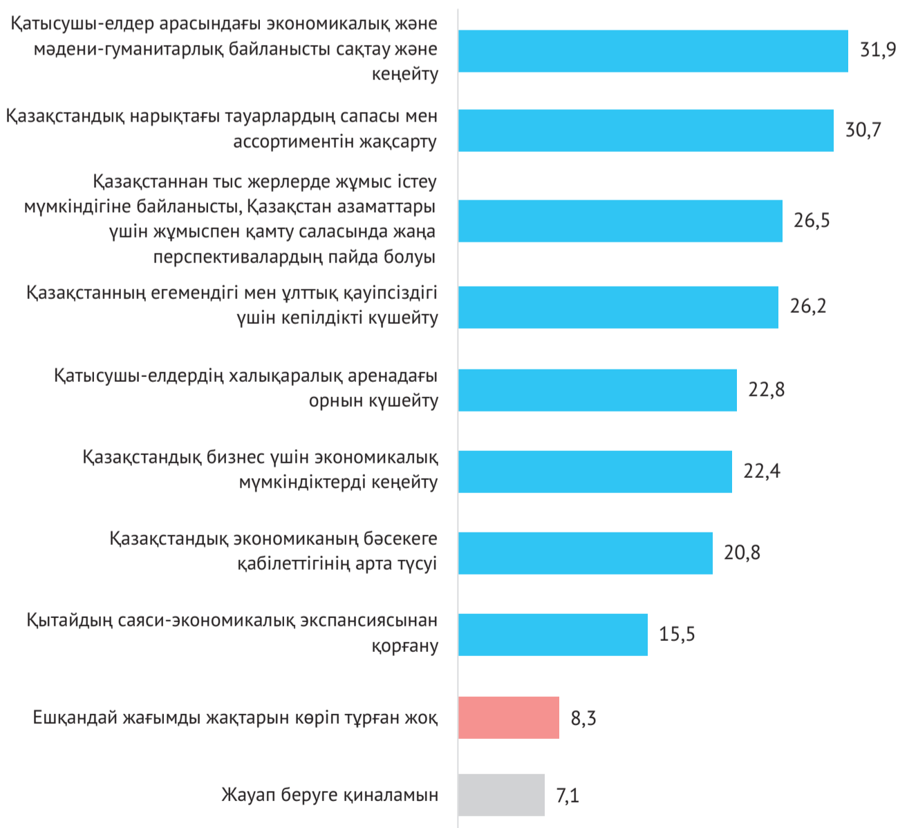
2-сурет. ЕАЭО қандай жағымды жақтарын көріп отырсыз? (%-бен)

Сауалнамаға қатысқандардың басым көпшілігі (84,6%) қатысушы-елдер үшін ЕАЭО әртүрлі жағымды жақтарын атап өтті. Бірінші кезекте, бұл қатысушы-елдер арасындағы экономикалық және мәдени-гуманитарлық байланыстарды сақтау және кеңейту, сондай-ақ қазақстандық нарықтағы тауарлардың сапасы мен ассортиментін жақсарту. Қазақстандықтар үшін жеке тұлғалар ретінде Қазақстаннан тыс жерлерде жұмыс істеу мүмкіндігі, сондай-ақ қазақстандық бизнесті кеңейту оң мүмкіндік болып табылады. Сондай-ақ, қазақстандықтар ЕАЭО-дан еліміз үшін егемендік пен қауіпсіздік кепілдігін көріп отыр.