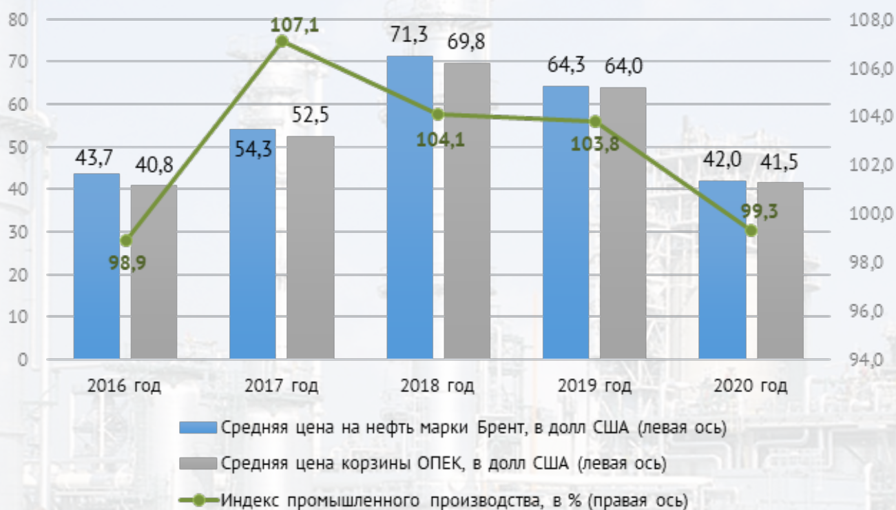
Рисунок 1. Влияние нефтяных цен на промышленное производство в Казахстане