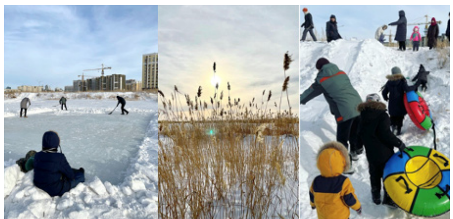
2-сурет. Эко-белсенділердің күшімен жасалған Талдыкөлдегі уақытша қоғамдық кеңістік, 2021 қаңтар

2021 жылдың қысында елорданың орталығында орналасқан Талдыкөл көлдерінің экожүйесінің тағдыры туралы жалғасып жатқан пікірталастардан кейін белсенділер көлдерде мұз айдыны мен балалар төбешігін салып, «демалыс күн» қоғамдық кеңістігін ұйымдастырды; оған бірнеше ондаған адам қатысты.