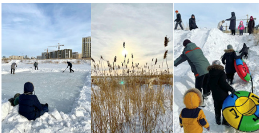
Рисунок 2. Временное общественное пространство на оз. Талдыколь (Нур-Султан), созданное силами эко-активистов, январь 2021

Зимой 2021 года, на волне продолжающихся дискуссий о судьбе экосистемы Талдыкольских озёр, расположенных в центре столицы, активисты организовали общественное пространство «выходного дня», построив на озёрах каток и детскую горку; участие приняли несколько десятков человек.